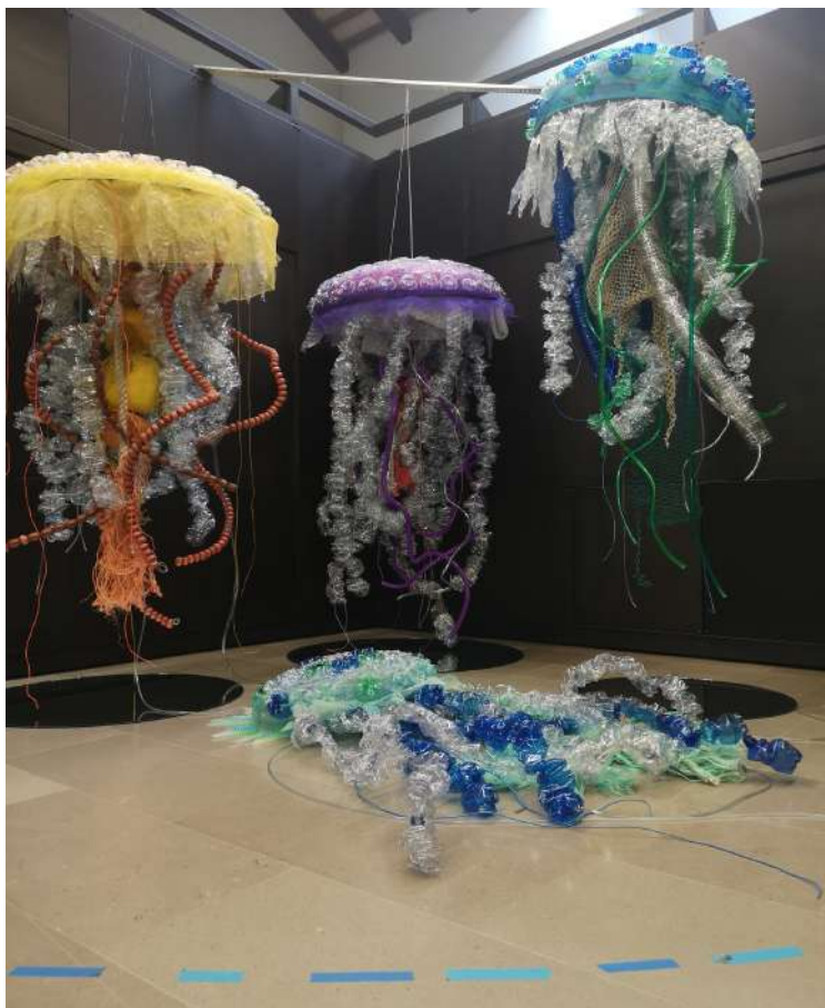
Exhibition PLATIC-OCENE Elisabetta Milan